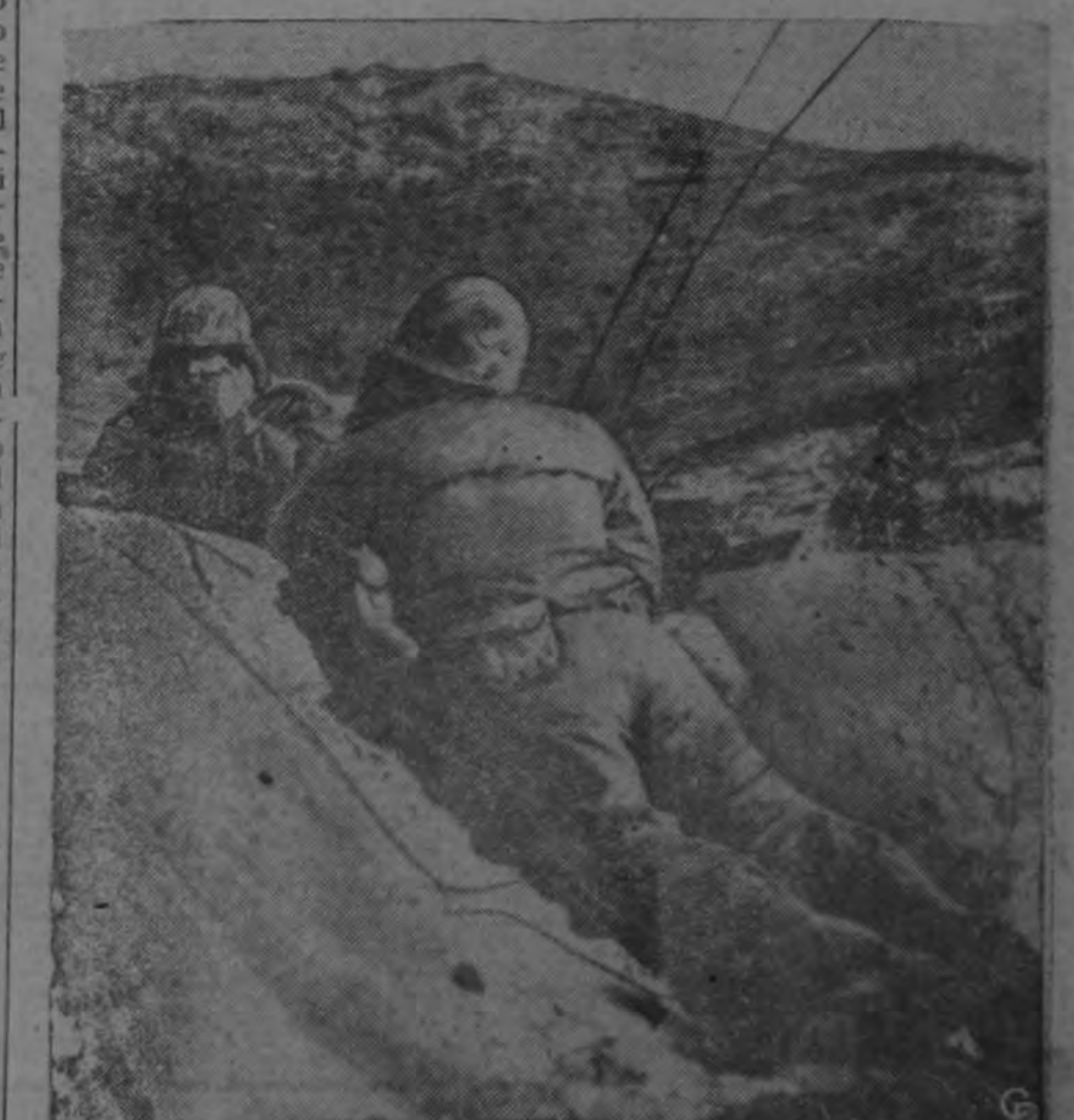
Desde un puesto avanzado de observación en el frente occidental de la Corea, dos soldados de las Naciones Unidas usan radios portátiles para dirigir el fuego de la artillería y los tanques que operan contra la colina Ungok. Al ser tomada la posición, se hallaron los cadáveres de 350 comunistas.—(INP).

WASHINGTON, 14. (INS). El Presidente Eisenhower convocó hoy a las autoridades superiores del gobierno en materia de energía atómica para una conferencia que deberá celebrarse el próximo lunes en la Casa Blanca y en la que, con gran probabilidad, se tratará de determinar la cuantía de los recursos que los Estados Unidos tendrán que poner en juego para perfeccionar la bomba de hidrógeno. La sesión ofrece perspectivas que parecen caracterizarla como una revalorización cabal del programa atómico norteamericano. Como portavoz de la Dirección del Programa de Física Nuclear actuará Gordon Dean que se retirará como Presidente de la Comisión de energía atómica. Al renunciar la conferencia del lunes la Casa Blanca dijo que tanto Dean como los miembros de la Comisión Thomas Murray, Eugene Zerkert y Henry de Wolf Smith, instruirán sobre los trabajos del grupo al Consejo Nacional de Seguridad. Al concluir concurrirán Eisenhower, el vicepresidente Nixon; el Secretario de Defensa Wilson y el del Tesoro Humphrey; el Subsecretario de Estado Graal. Smith, y el Secretario Auxiliar de Defensa Kyes; el Secretario de la Fuerza Aérea Talbott, el del ejército Stevens y el de Marina Anderson; el general Bradley, Jefe del Estado Mayor conjunto; el Director de Presupuestos Dodge; el Secretario Ejecutivo del Consejo de Seguridad, James Lay, y el Auxiliar Administrativo del Presidente, Robert Cutler.