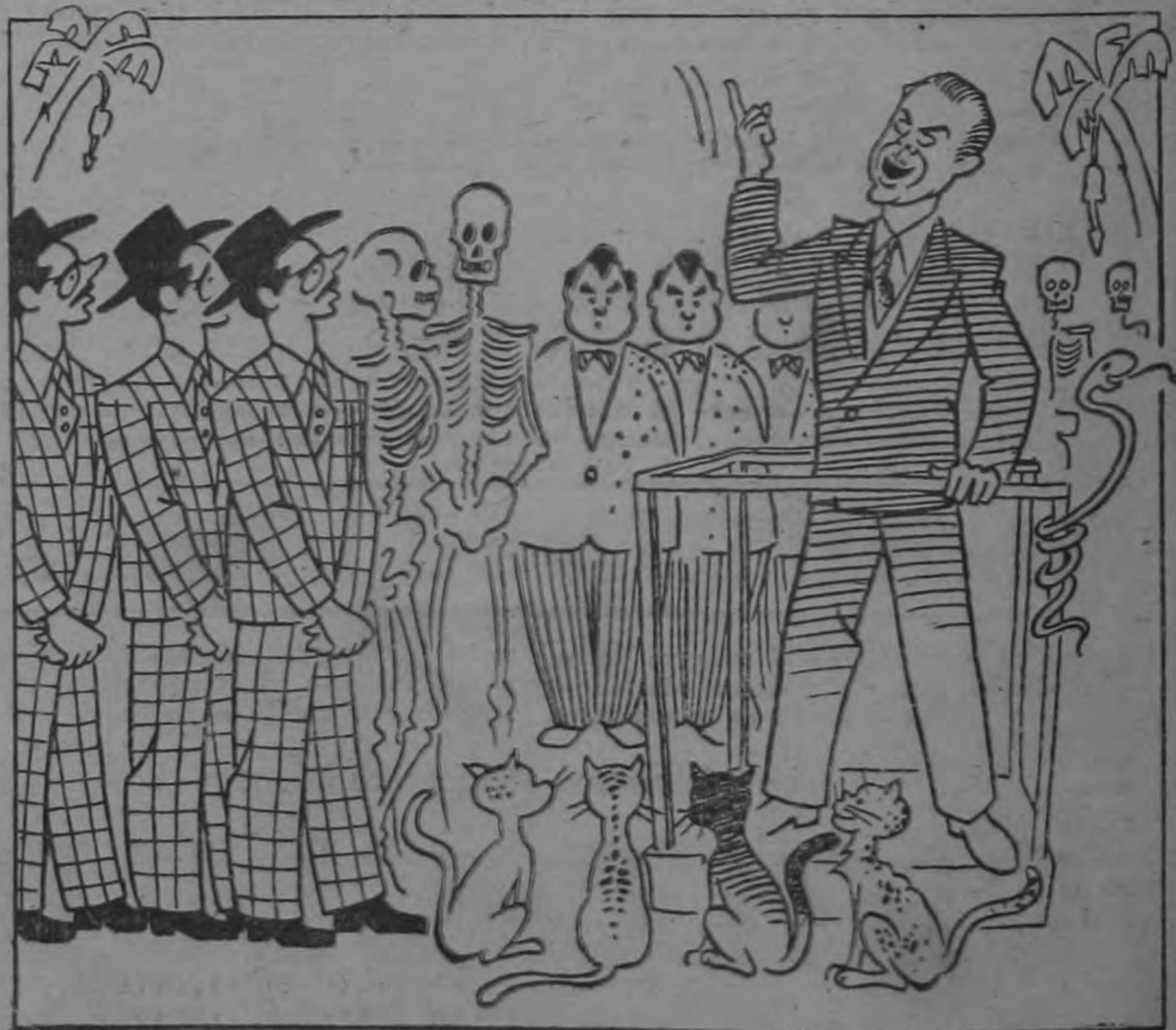
Entre muertos y repetidos, amén de sus consabidos cuatro gatos, don Fernando ha conseguido ajustar sus famosos "doce mil"...