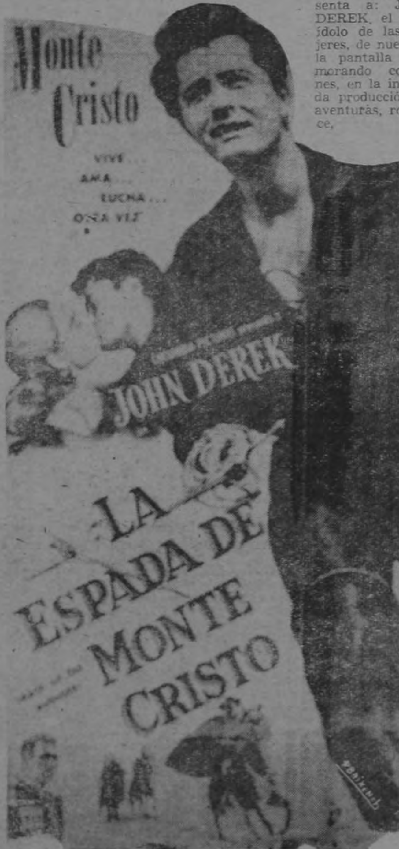
DUELOS A ESPADA DE FEROCIDAD UNICA!